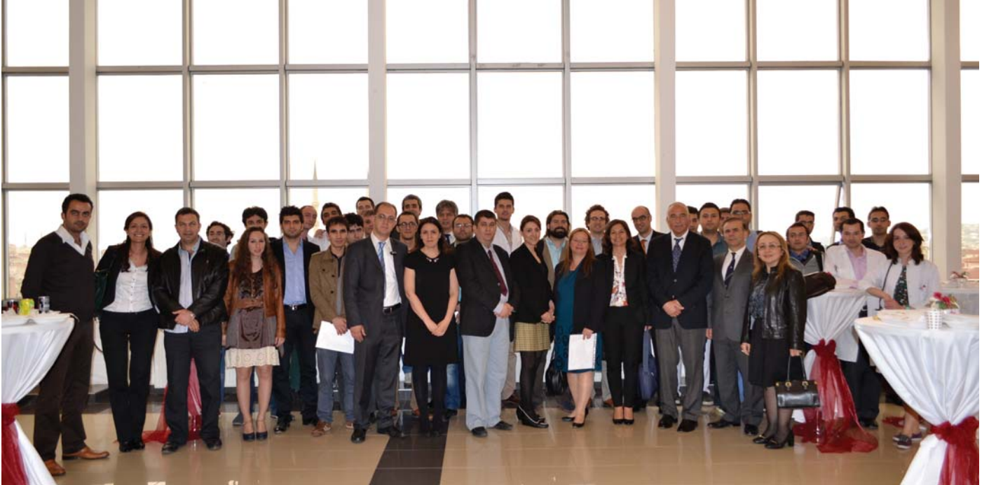
Katılımcılardan Kongre anısı

İstanbul Bölge toplantılarının ikincisi, Lütfi Kırdar Kartal Eğitim ve Araştırma Hastanesi'nin ev sahipliği ile 8 Mayıs 2014 tarihinde gerçekleştirildi. "El Cerrahisinde Zor vaka" konulu toplantıya, yaklaşık 50 meslektaşımız katılarak, bilimsel katkı sağladılar.