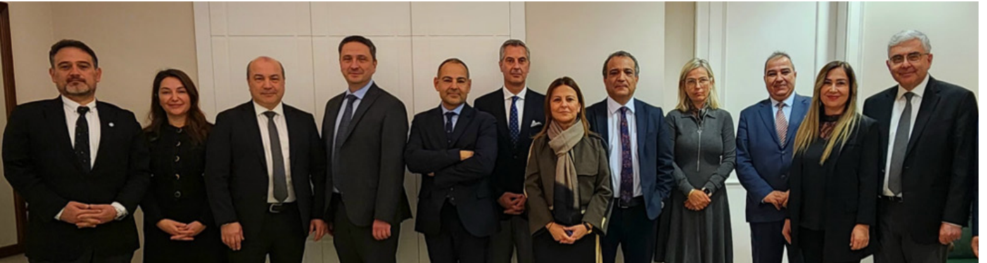
Sağlık Bakanı ile görüşme

Tüm bu çabalar sonucunda, her ne kadar 6 Ekim 2022 yönetmeliğinde tam anlamıyla bir düzeltme sağlanamamış olsa da, Bakanlık yönetmeliğinin bazı maddelerini değiştirdi.