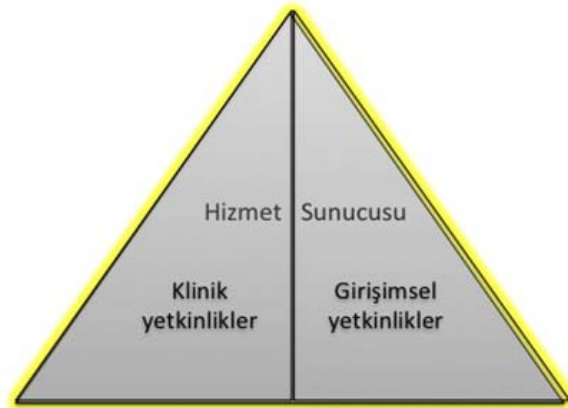
Şekil 2- TUKMOS yedinci temel yetkinlik alanı: Hizmet Sunucusu

Girişimsel Yetkinlik: Bilgiyi, kişisel, sosyal ve/veya metodolojik becerileri tıbbi girişimler konusunda kullanabilme yeteneğidir.